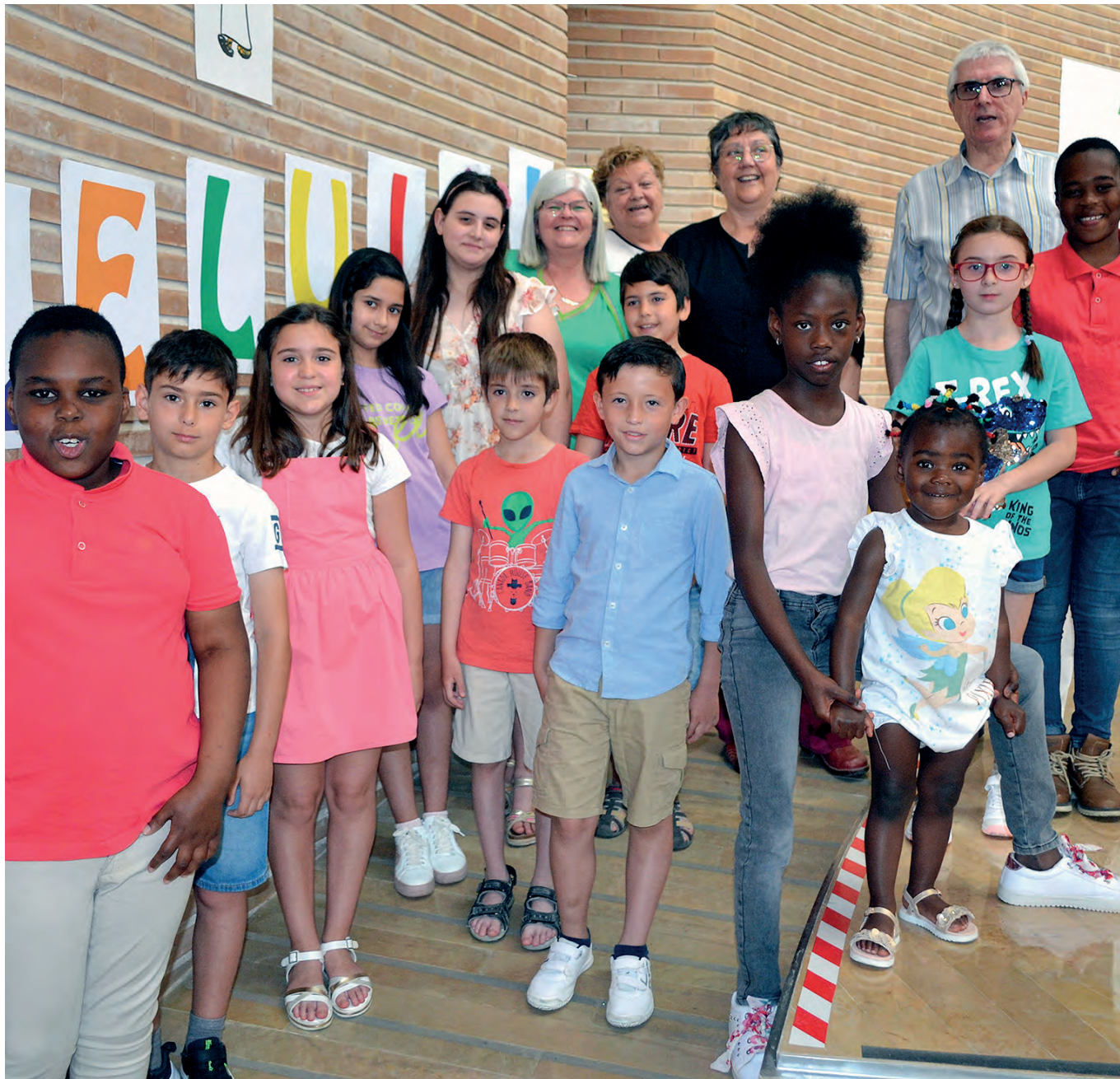
Catequistes i infants de la Unitat Pastoral Agermanada Pilar-Magdalena.

comunitat parroquial, que havien acompanyat el procés de creació de la Unitat Pastoral. Gent formada i espiritualment ferma. Amb ells i elles, hem anat fent camí i ens entenem bé i des de fa uns anys estem engrescats en el procés de renovació parroquial, amb el qual estem molt esperançats, compromesos i determinats.”