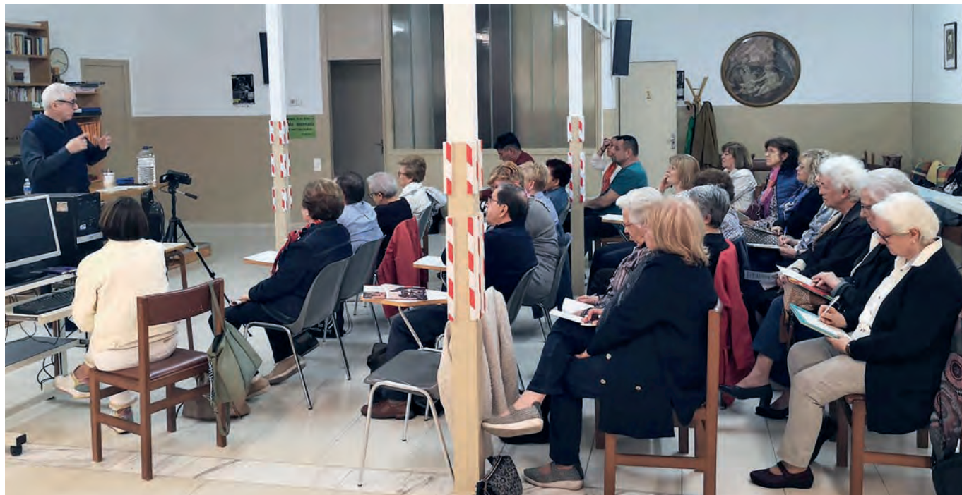
Trobada formativa del grup de renovació pastoral.